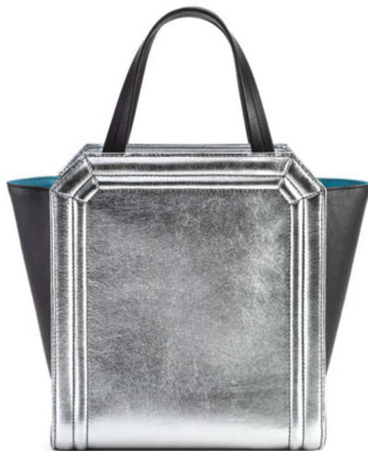
Handbag design, Badura.

Metal, metal e ancora metal . Tra i trend forti del momento ci sono gli accessori nella loro versione più sparkling. Come le borse argento , ad esempio! Non relegarle in quella parte del guardaroba dedicata alla sera. Il vantaggio delle silver bag, infatti, è che danno il meglio sotto il sole. Luccicanti, originali e portabili anche con un semplice short di denim + camicia, sono uno degli accessori must have dell'estate 2016 . Te ne proponiamo 15 tra shopper, minibag, pochette e portatutto, da acquistare odesso, magari in saldo, e usare tutta la vita!